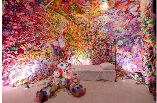
2014 Colorful Rebellion -Seventh Nightmare- ニューヨーク

ポーラ ミュージアム アネックス(東京・中央区銀座)では、KAWAII 文化を中心にエンターテインメントやファッション、アートなど様々な分野で活躍するアーティスト 増田セバスチャンによる日本初のインスタレーション展覧会 "Point-Rhythm World -モネの小宇宙-" を2017年7月21日(金) から9月3日(日) まで開催します。