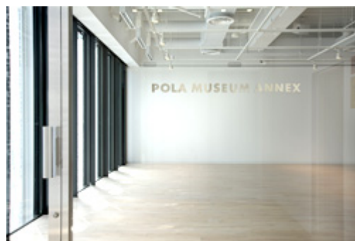
ポーラ ミュージアム アネックス