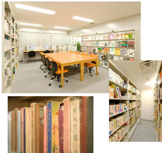
リニューアルしたポーラ化粧品文化情報センター

http://www.po-holdings.co.jp/csr/culture/bunken/