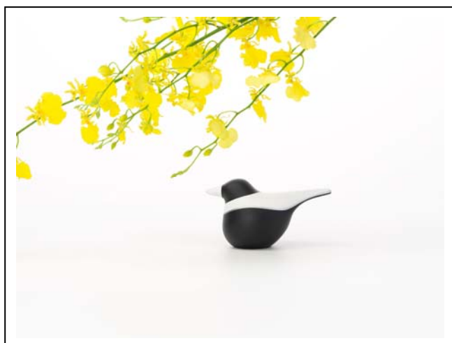
本展覧会作品 Bird robot

本展では、日本画の花鳥画にインスパイアされた松井氏の考える自然観「花鳥間」を会場に見立て、木々や花に覆われた空間に小鳥の形をしたロボット達が静かに佇みます。環境と人工物との程よい理想関係を示した空間で、人が自然から感じ取る瑞々しい感性に語りかけます。会期中、ギャラリートーク以外にも環境やエコをテーマにしたコラボトークも開催予定です。