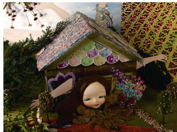
新作『こども部屋のアリス』より「アリス・煙突・トカゲ」