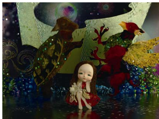
新作『こども部屋のアリス』より 「エビ踊りをするグリフォンとウミガメもどき」