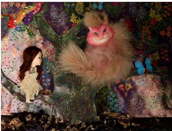
新作『こども部屋のアリス』より「チェシャ猫とアリス」