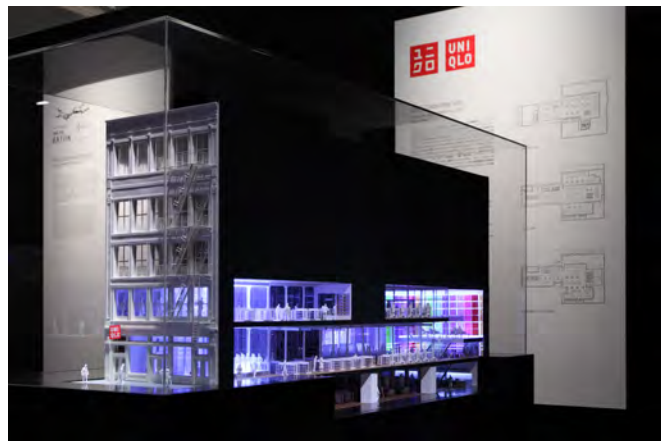
前回の会場写真より（左右とも）