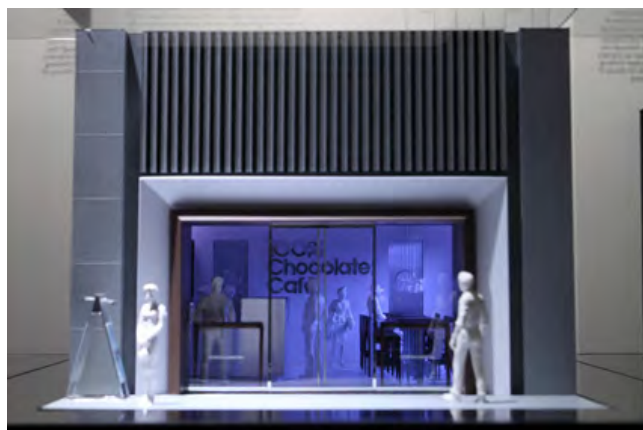
前回の会場写真より（全て）

* コピーライト表記は必要ありませんが、写真はすべて前回の会場写真のため、注釈を入れてください。