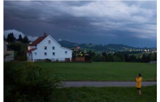
「Wind Ensemble (in four movements)」