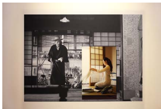
「All is fish that comes to the net」 2014年 ポスター、フォトアクリル