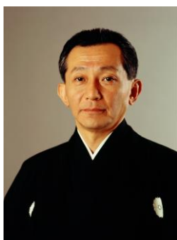
観世 清和 (かんぜ きよかず)