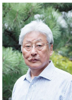
中川 衛 (なかがわ まもる)

1959年東京生まれ。父は25世宗家 観世左近元正。1990年家元継承。室町時代の観阿弥、世阿弥の子孫二十六世宗家として、現代の能楽界を牽引する。1995年度芸術選奨文部大臣新人賞受賞。1999年フランス文化芸術勲章シュバリエ受章。2012年度芸術選奨文部科学大臣賞受賞。2013年伝統文化ポーラ賞大賞受賞。2015年「紫綬褒章」受章。2019年度JXTG音楽賞受賞。重要無形文化財総合認定保持者。