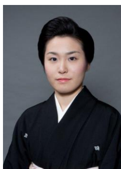
井上 安寿子 (いのうえ やすこ)

1947年石川県生まれ。金沢美術工芸大学卒業。1974年より高橋介州に師事。1979年日本伝統工芸展初入選。1988年日本伝統工芸展「朝日新聞社賞」受賞。1996年金沢美術工芸大学教授。2004年伝統文化ポーラ賞優秀賞受賞、重要無形文化財「彫金」保持者認定。2006年東京三越本店初個展。2008年メトロポリタン美術館に作品収蔵。2009年「紫綬褒章」受章。2010年大英博物館に作品収蔵。記録映画「加賀象嵌 中川衛 美の世界—新たな伝統を創る—」(ポーラ伝統文化振興財団企画、2011年)。