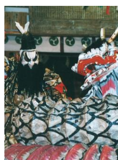
有福神楽保持者会 【島根県】

北上和賀地方に伝わる鬼剣舞の源流。大宝年間(701~704年)、修験の祖である役行者(小角)が念仏を唱えながら踊ったことに始まるとされる。いわゆる「念仏剣舞」の一種であるが、威嚇的な鬼のような面をつけ勇壮に踊るところから、「鬼剣舞」と呼ばれる。国指定重要無形民俗文化財。記録映画「みちのくの鬼たち—鬼剣舞の里—」(ポーラ伝統文化振興財団企画、1996年)。