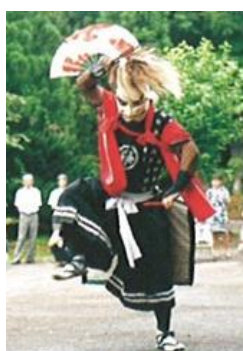
岩崎鬼剣舞保存会 【岩手県】

1975年石川県生まれ。1997年石川県九谷焼技術研究所卒業。2000年伝統九谷焼工芸展技術賞(2005年、2009年)、2010年全国伝統工芸品公募展経済産業省製造産業局長賞受賞。2011年「REVALUE NIPPON PROJECT—中田英寿 現代陶芸と出会う—」(茨城県陶芸美術館)、2012年「工芸未来派」(金沢21世紀美術館)、2014年パラミタ陶芸大賞展大賞(パラミタミュージアム)、2015年度石川デザイン賞受賞、2019年伝統文化ポーラ賞奨励賞受賞。