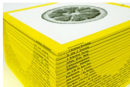
太田泰友 「Frucht I」 2017年