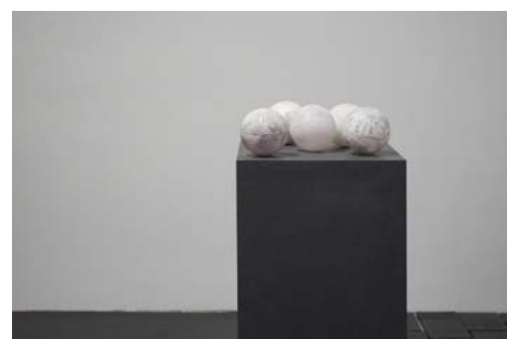
林恵理 「O.T.」 2017年 130 x 45 x 50cm 素材：ガラス