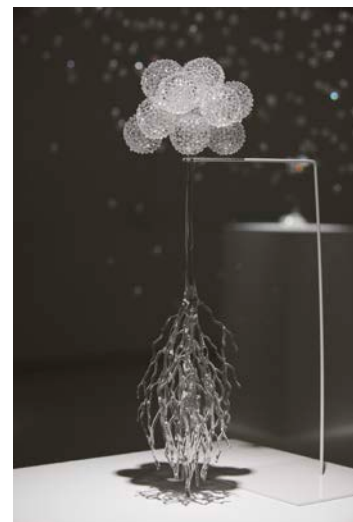
青木美歌 「Wonder」 2017年 w13xd12xh42 cm 素材：ガラス