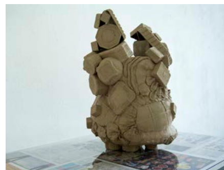
寺嶋綾香 「der Topf」 2019年