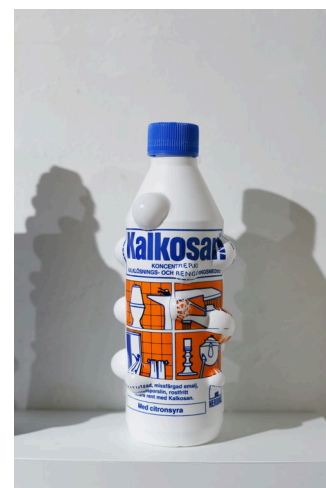
「bottle」2020年 プラスチックボトル 90x210x90mm