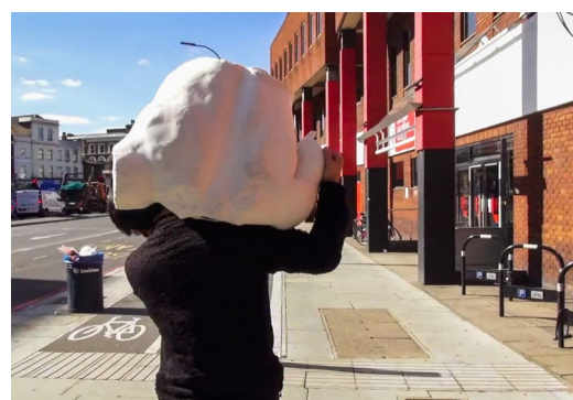
「A Sculptor」 2018 HD Video 9 mins