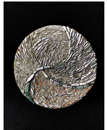
「流動の破片」 2018年 大理石/モザイク画 30×30×3cm