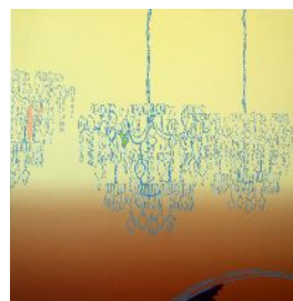
遠藤 良太郎 2004年